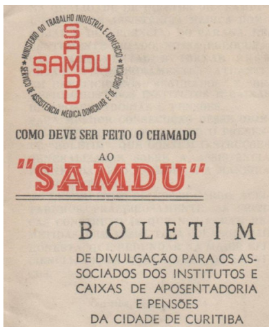
Ilustração 3. Capa do Boletim SAMDU